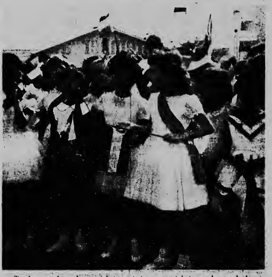
Tambe e muchu nobrianan tabata canta tur cu nan tabata por den e aubade.